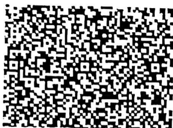
马思宝的年检二维码.png

本证书经检验合格，继续有效一年。 This certificate is valid for another year after this renewal.